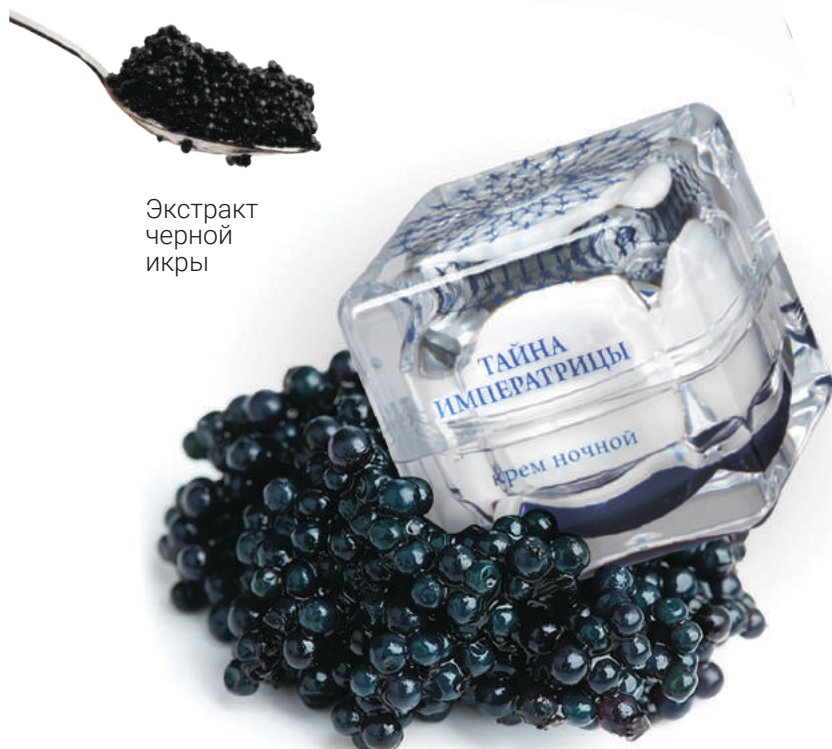
Экстракт черной икры

Коллекция состоит из 4 видов крема для лица: ночного с высокотехнологичным экстрактом черной икры, регенерирующего с женьшенем и облепиховым маслом, увлажняющего с гидратирующим комплексом Hydrovite 24 и омолаживающего с женьшенем, маслами виноградной косточки и ши. Объединяющим все кремы компонентом стал экстракт фарфорового цветка, который увлажняет кожу и делает ее сияющей и белой как фарфор.